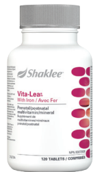
VITA-LEA MD LA MEILLEURE MULTIVITAMINE

Choisissez votre Multi et votre Protéine. La fondation d'une vie plus saine.